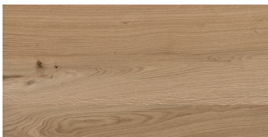
Dąb rustykalny PW360